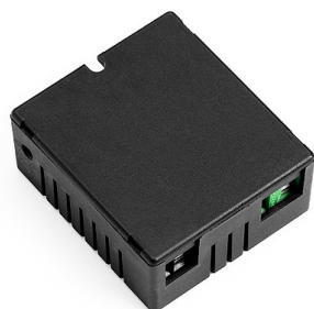
RF22227 Dimmer parete