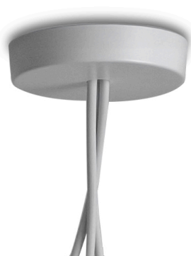
F0093009 Rosone multiplo - Bianco