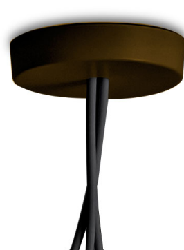
F0093026 Rosone multiplo - Marrone