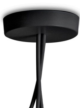
F0093030 Rosone multiplo - Nero